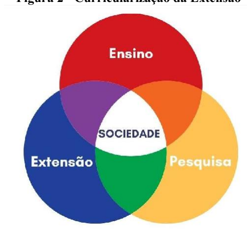
Figura 2 - Curricularização da Extensão

A inserção das atividades extensionistas no currículo tem como potencial promover o alinhamento da universidade com as demandas da sociedade, possibilitando uma aprendizagem transformadora, a formação de um cidadão crítico, capacitado para o mundo do trabalho e para lidar com os problemas reais presentes no contexto social. Além disso permite quebrar a segregação entre o ensino, pesquisa, extensão e questões da sociedade, conforme observamos na Figura 3Figura 2: